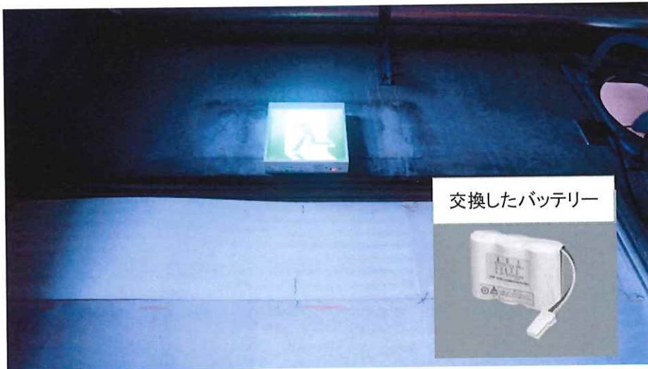
交換したバッテリー